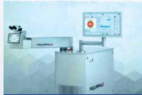
Рис. 7. Лазер Aquarius (Ziemer) – новейшая технология кератоабляции

Профессор Алексей Юрьевич Слонимский представил новый твердотельный лазер Aquarius швейцарской компании Ziemer для рефракционных операций (рис. 7). В отличие от эксимерных лазе-