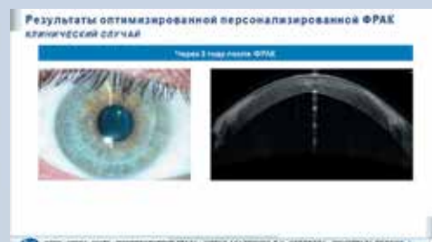
Рис. 6. Роговица пациента после ФРАК

Восстановление зрения после ФРАК занимает достаточно долгое время и требует терпения от пациента и хирурга, однако персонализированный подход позволяет добиться значительного стойкого итогового улучшения зрения у пациентов с кератоконусом без пересадки роговицы (рис. 6).