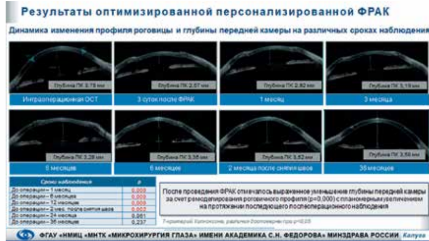
Рис. 5. Динамика изменения профиля роговицы, глубины передней камеры и остроты зрения у пациента с кератоконусом после персонализированной ФРАК

разработали метод комбинированной шовной фиксации краев циркулярного разреза роговицы: для более равномерного натяжения роговицы было предложено использование 16 узловых швов и одного непрерывного обвивного шва.