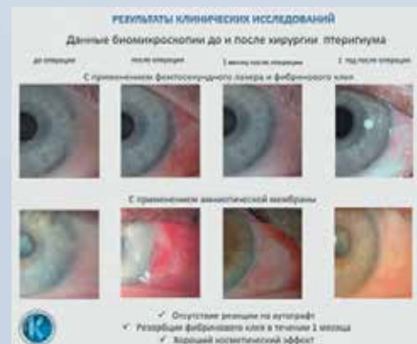
Рис. 2. Динамика данных биомикроскопии после удаления птеригиума с фемтолазерным сопровождением на Femto LDV Z8 и применением фибринового клея в сравнении с удалением птеригиума и пластикой амниотической мембраной с наложением швов

Применение фемтосекундного лазера позволило сократить время операции в 1,5 раза по сравнению с мануальной аутопластикой конъюнктивы и наложением швов или с пластикой амниотической мембраной. В группе фемтосопровождения реже