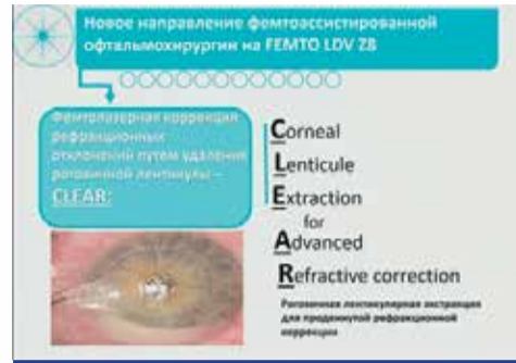
Рис. 1. CLEAR – это новое направление фемтолазерной коррекции зрения на платформе Femto LDV Z8

CLEAR (Corneal Lenticule Extraction for Advanced Refractive correction, экстракция роговичной лентикюлы для продвинутой